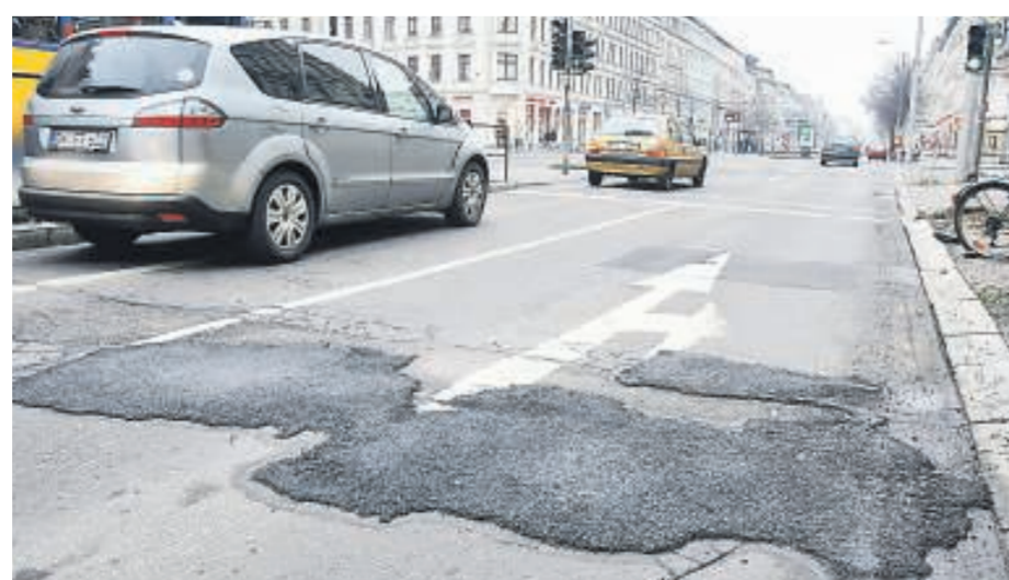
Weil dieses Schlagloch in der Karl-Liebnecht-Straße schon zum zweiten mal geflickt werden musste, ist jetzt ein Straßenbuckel entstanden – zum Ärger vieler Anlieger.