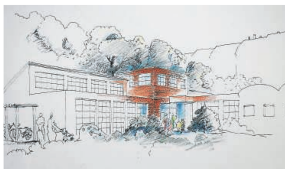
Die Entwürfe für den Buchkindergarten sind fertig. Der zweistöckige Bau soll auch eine Werkstatt für die Produktion der Bücher beheimaten. Zeichnung: Architekturbüro Friebe

Auch das Haus Nummer 9 ist zum Abriss vorgesehen. „Der Privatbesitzer sollte mit Fördermitteln unterstützt werden, dann aber waren die Gelder des Amtes für Stadtentwicklung erschöpft“, so Riemer. Auch dieses Problem muss schnellsten gelöst werden, denn das Datum für die Kita-Eröffnung haben die Organisatoren fest im Kopf: den Kindertag am 1. Juni 2010.